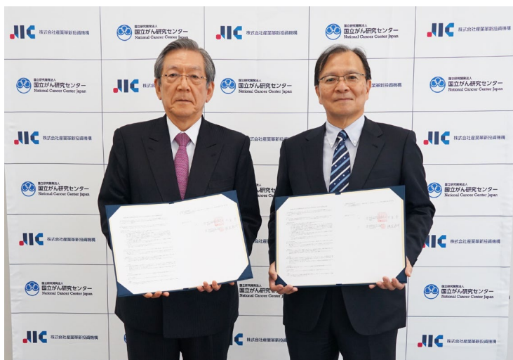
2023年12月14日締結式の様子

本協定は、国立がん研究センターとJICが、医療分野の研究開発成果の実用化を図ることにより、高度かつ専門的な医療の向上とともに我が国次世代の産業創出に結びつくよう、相互に連携及び協力することを目的としています。