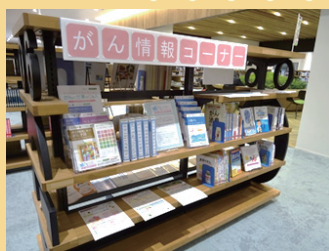
徳島県美馬市立図書館