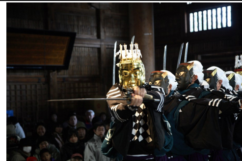
無形文化遺産「大日堂舞楽」