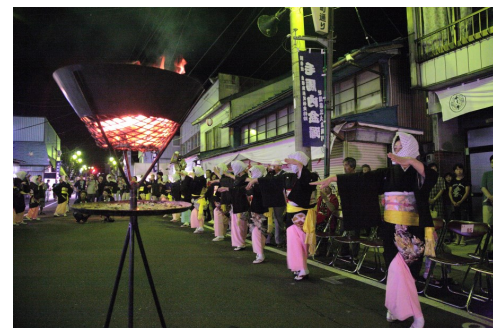
無形文化遺産「毛馬内の盆踊」(風流踊)