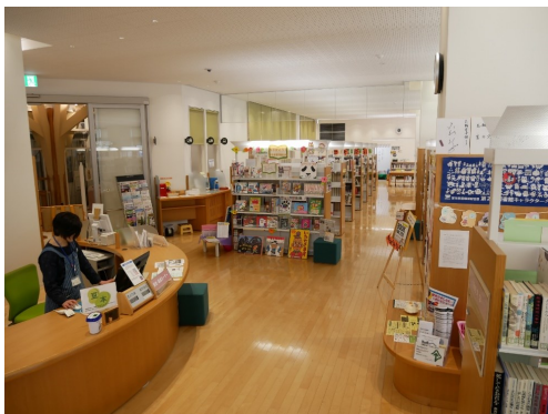
鹿角市立花輪図書館