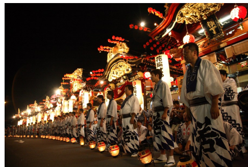
無形文化遺産「花輪祭の屋台行事」(山・鈴・屋台行事)