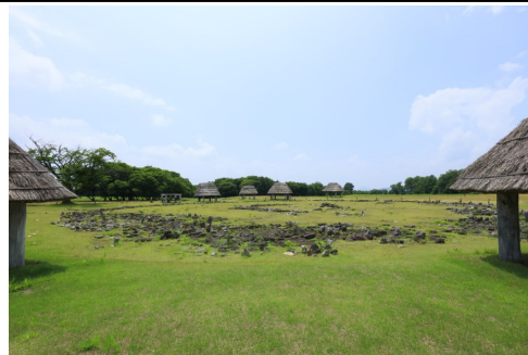
世界文化遺産「大湯環状列石」(北海道・北東北の縄文遺跡群)