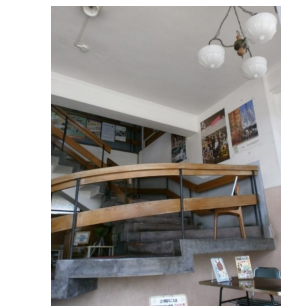
鹿角市立立山文庫継承 十和田図書館