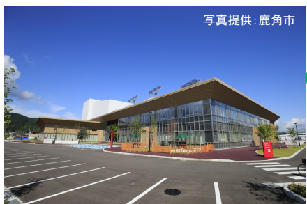
鹿角市文化の杜交流館コモッセ