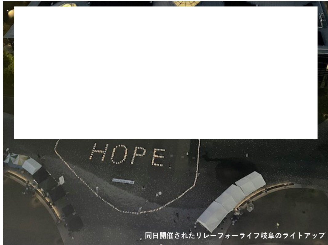
同日開催されたリレーフォーライフ岐阜のライトアップ