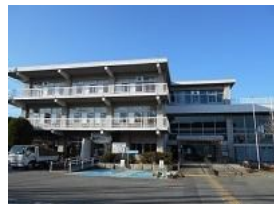
社会科学と歴史・哲学の 熊谷図書館