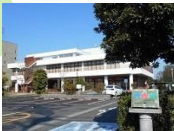
自然科学と芸術・文学の 久喜図書館