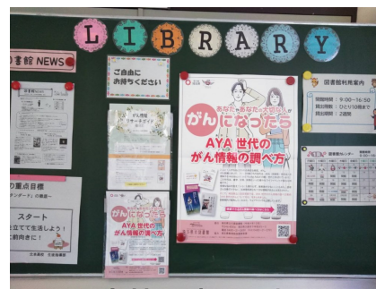
県立高校図書館で掲示