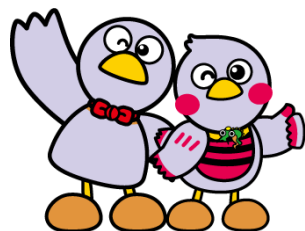
埼玉県のマスコット コバトン&さいたまっち