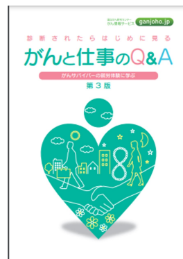
出典「国立がん研究センターがん情報サービス」