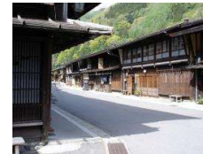
中山道宿場町奈良井宿