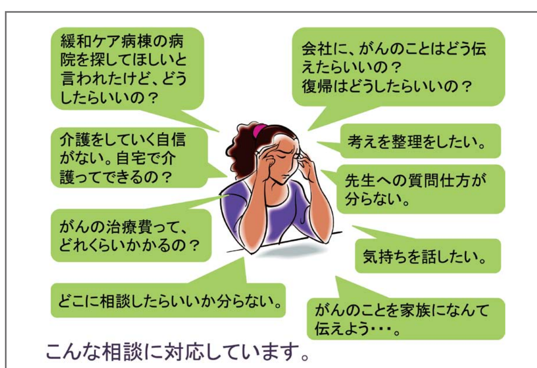
こんな相談に対応しています