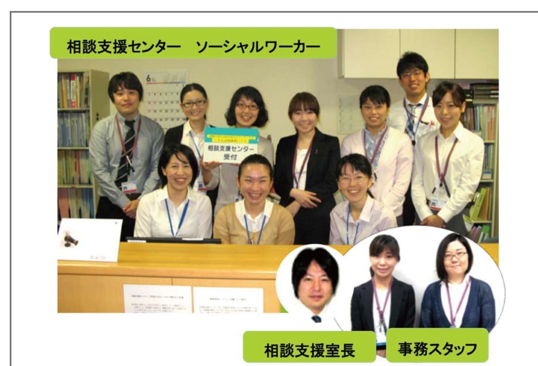
相談支援センターメンバー