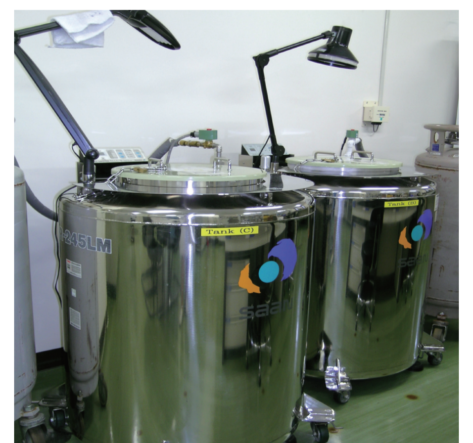
試料保管用の液体窒素タンク