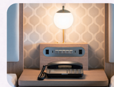
直通電話(ベッド横)