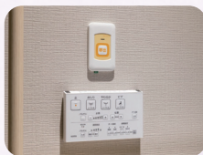
呼び出しボタン(トイレ)