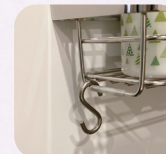
医療器具用フック