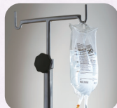
点滴スタンド (貸出)