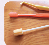
口腔用 スポンジブラシ (コンビニ販売)