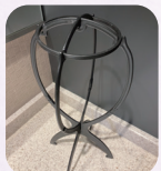
ウィッグスタンド (貸出)

下記写真以外の備品もご準備しておりますので、お気軽にスタッフまでお声がけください。