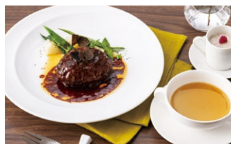
トリュフ入り ハンバーグ パン or ライス or お粥 付き