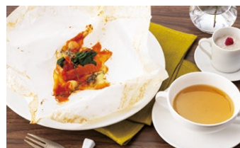
サーモンのボービエット パン or ライス or お粥 付き

※お食事内容や料金は予告なく変更になる場合がございます。 ※ディナータイム(17:30~21:00)は別途サービス料(5%)を頂きます。