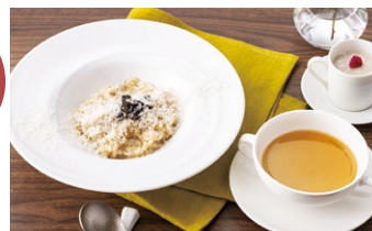
トリュフ入り リゾットスープ