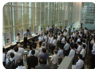
C-square EXPO 2015 ものづくり企業プレゼンの様子