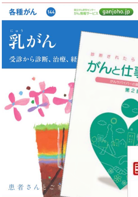
がん対策情報センター