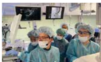
研修者による Interventional EUS