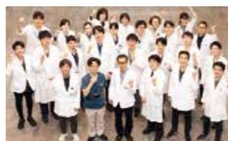
肝胆膵内科 集合写真

肝胆膵癌の薬物療法(治験、臨床試験を含む)と、ERCP や EUS (FNA、ドレナージ)を使った胆膵内視鏡の両者を、最先端かつ国内トップレベルの症例数と指導力で徹底的に学ぶことができます。